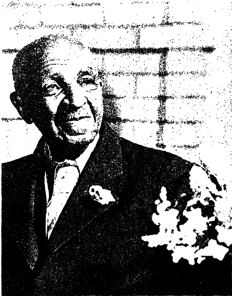
जॉर्ज वाशिंगटन कार्वर ७५